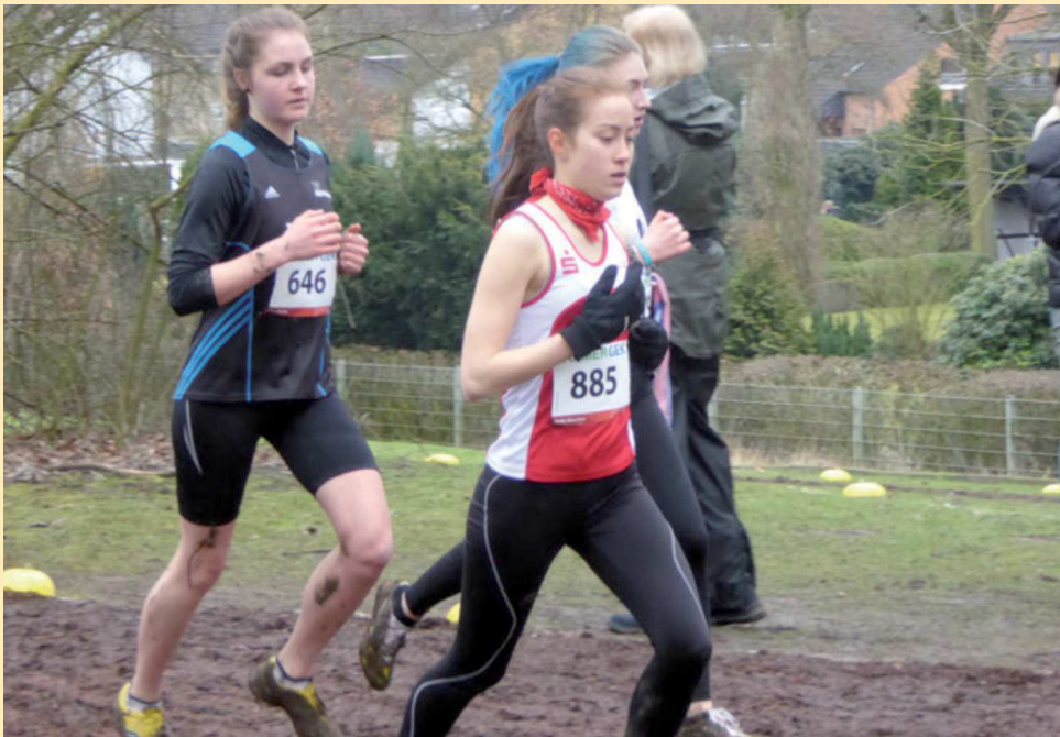
Maiko in der zweiten Runde des Crosslaufes