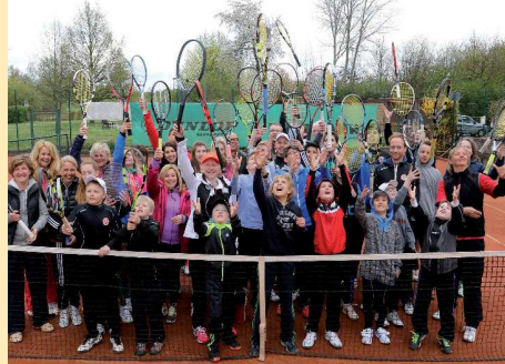
Hoch, höher, am höchsten: Kinder, Jugendliche und Erwachsene des TuS Westfalia Hombruch zeigen, wie sehr sie den Tennissport lieben.