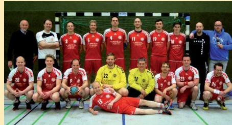
Auch erfolgreich in 2016: Die 2. Mannschaft des TuS Westfalia Hombbruch