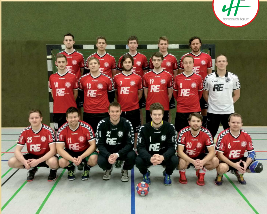
Die 1. Herren-Handballmannschaft des TuS Westfalia Hombruch